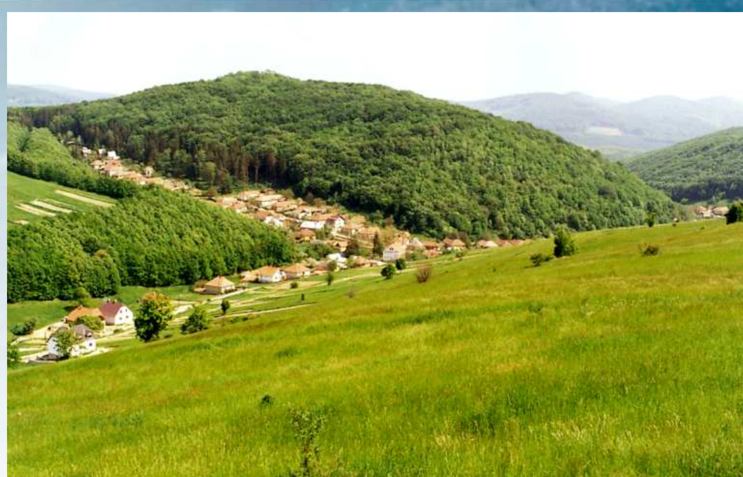
Répáshuta lát képe