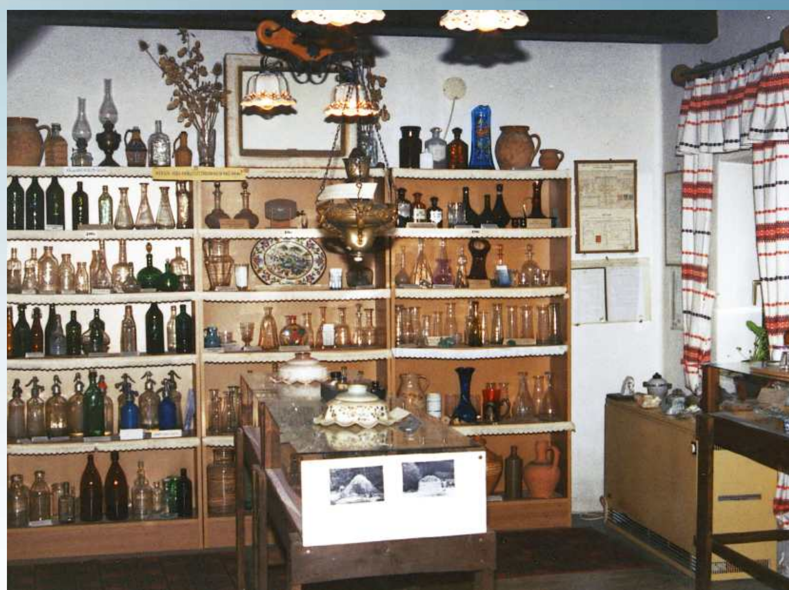
A Bükki Üveghuták Múzeum és mőtárgyai

Bükkszentkereszt Magyarország legmagasabban fekvő települése, kiváló természeti adottságokkal. A természeti szépségeken túl a régmúlt korok történelmi és régészeti emlékei is bőségesen megtalálhatók itt és közvetlen környezetén. Fokozza az érdeklődést Újhuta levegőjének különleges gyógyhatása. Mind több komfortos szálláshely, kulturált vendéglátó egység várja itt a turistákat. Az „Európai Vaskultúra Útja Magyarországi Állomási” méltán vehetik e helységet soraikba.