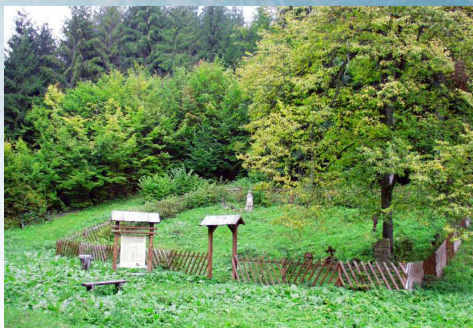
A gyertyánvölgyi üveghuta temetője